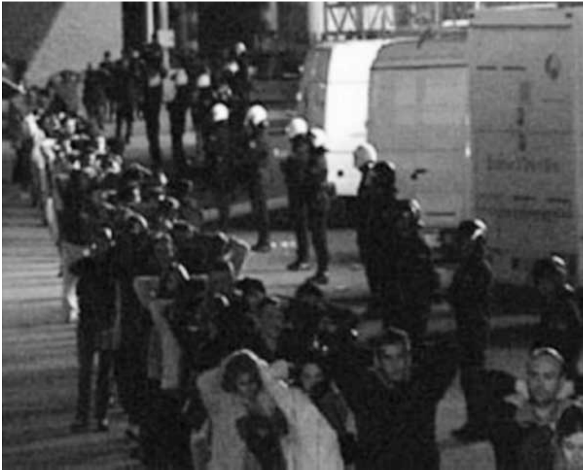
Periodistas y trabajadores de Antena3 detenidos por las fuerzas policiales.